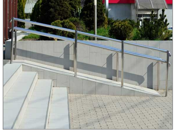
شكل (١): منحدر للأشخاص ذوي الإعاقة