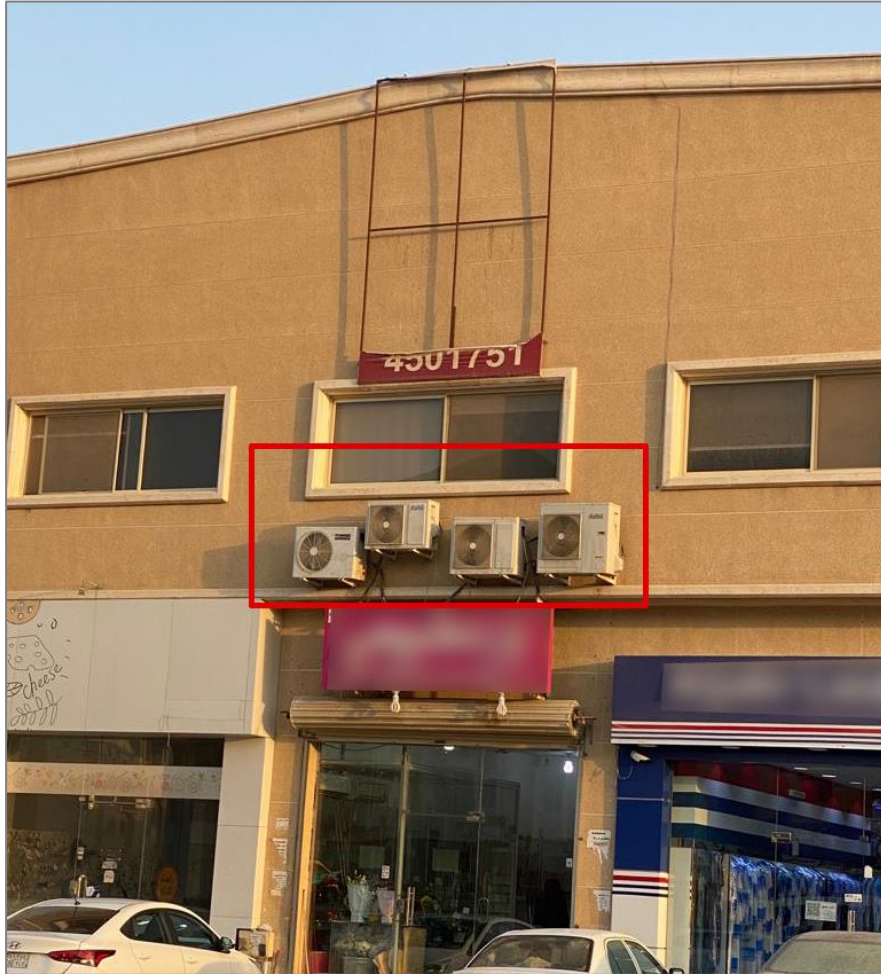
شكل (3): وحدات تكييف منفصلة (مخالفة) في واجهة المبنى