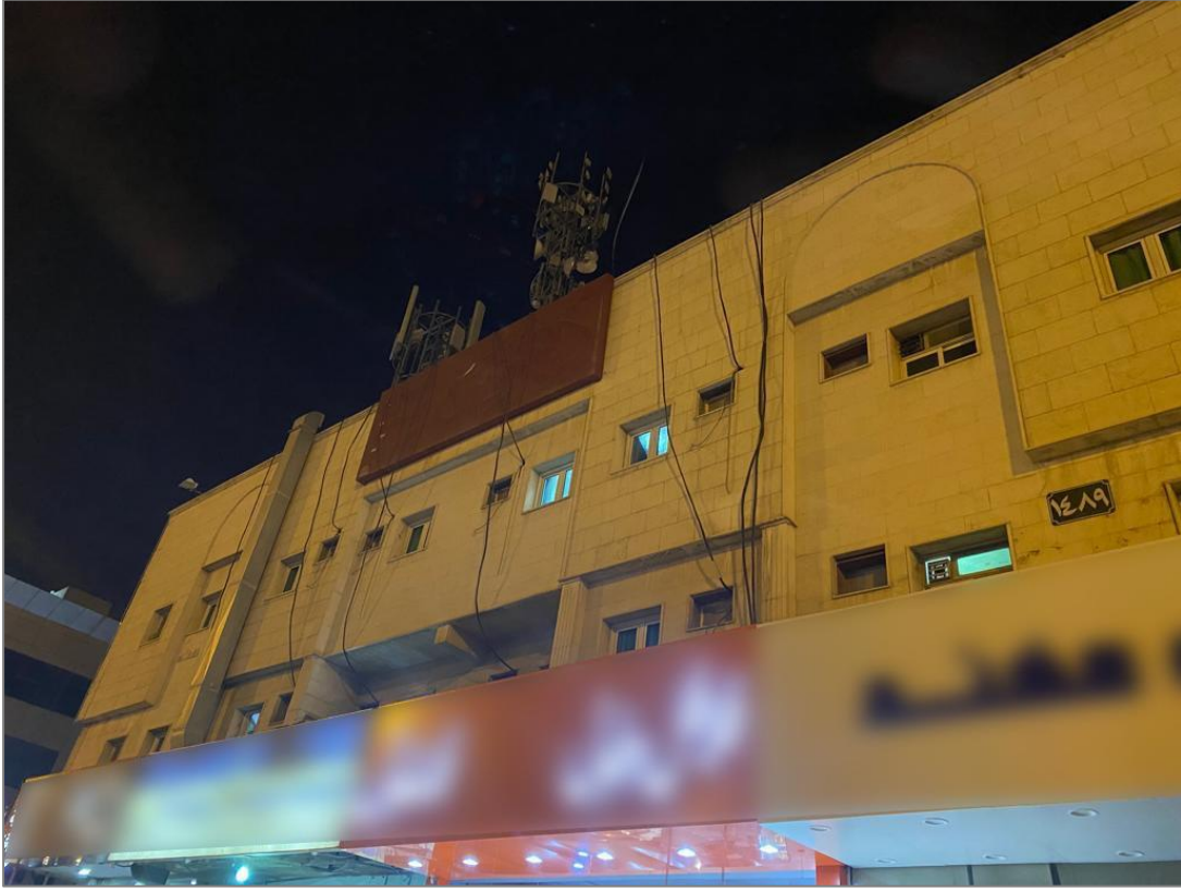
شكل (٤): تمديدات كهربائية والاتصالات (مخالفة) في واجهة المبنى