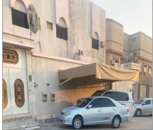
شكل (٧): مخالفة وجود مظلات أو هناجر خارج حدود البناء