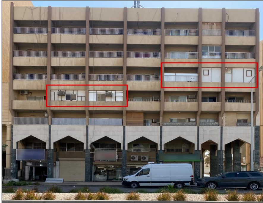
شكل (٦): مخالفة تغطية الشرفات بهناجر أو مواد لا تتناسب مع شكل المبنى

٩,٣ عدم وضع المداخل على واجهة المبنى، وعدم تجاوز المداخل إرتفاع البناء بأكثر من (٢) متر . ١٠,٣ وجود الغطاء الخاص بخزانات المياه على الأسطح للمحافظة على جودة المياه ومراعاة السلامة.