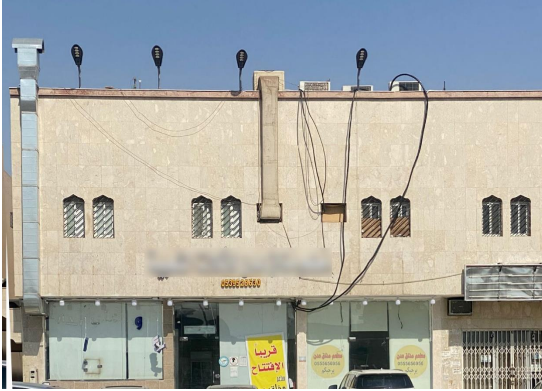
شكل (٥): تمديدات كهربائية وصحية (مخالفة) في واجهة المبنى